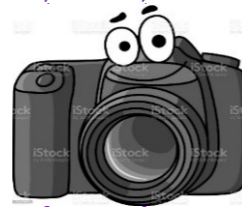
Tableau de l'illusion